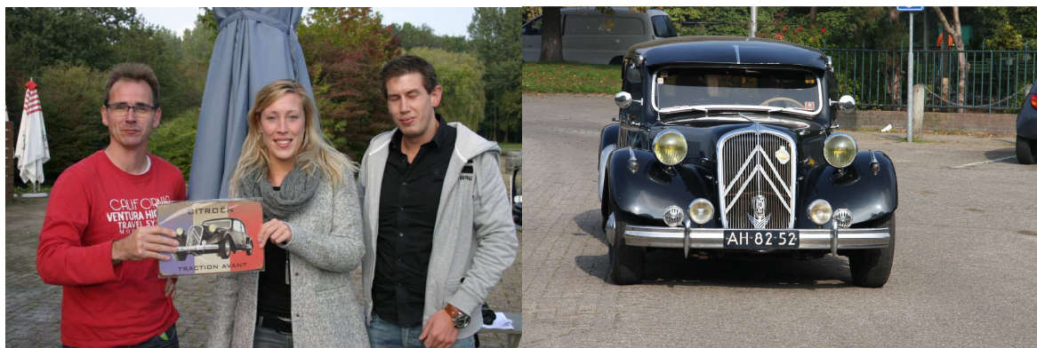
Het winnende team

Nogmaals van harte gefeliciteerd. En ik heb inmiddels begrepen dat de trofee een mooie plek in de garage krijgt.