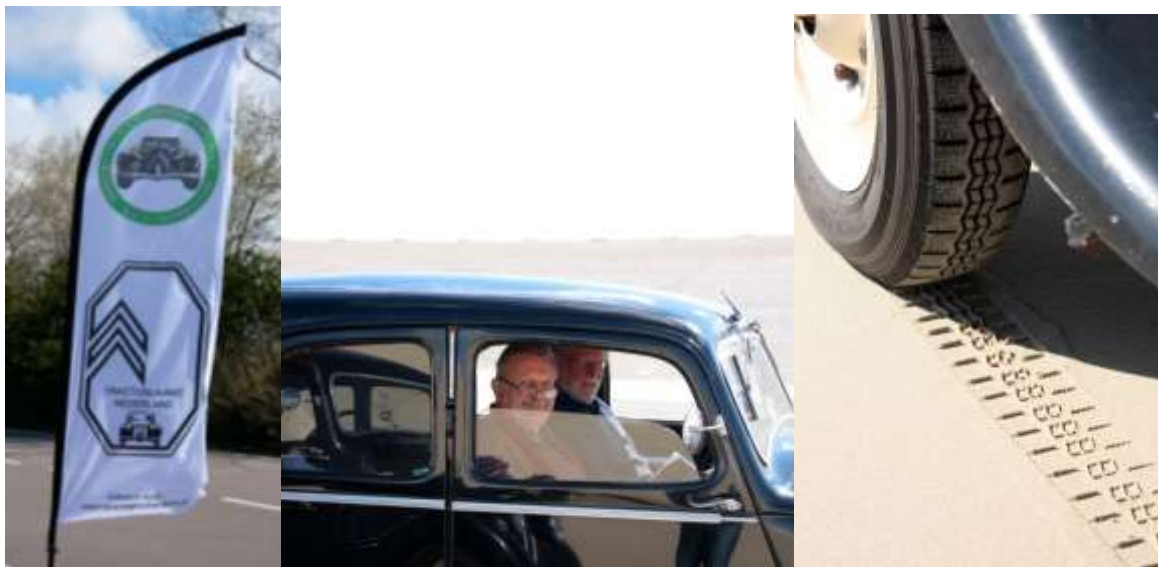
Het winnende team